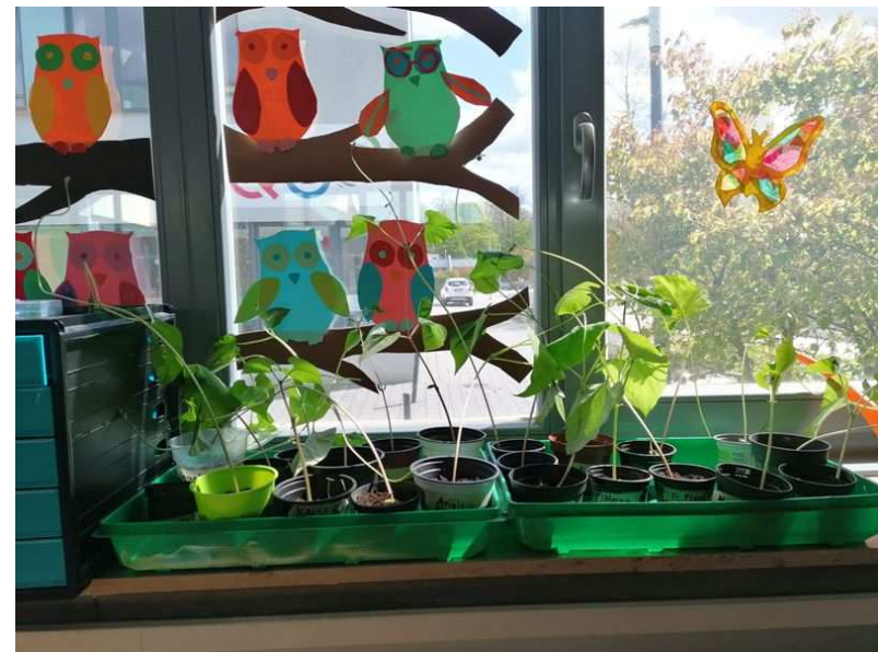
GS an der Robinsbalje